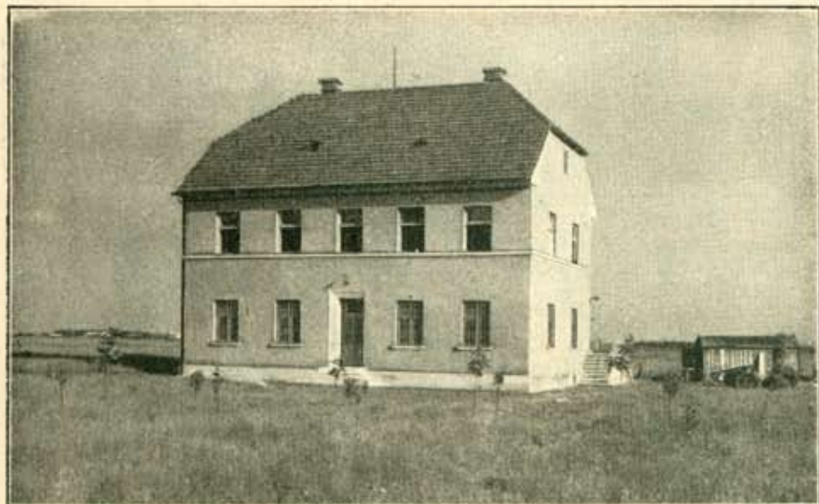
Zavod za bilinogojstvo i zavod za uzgajanje šuma u Maksimiru.