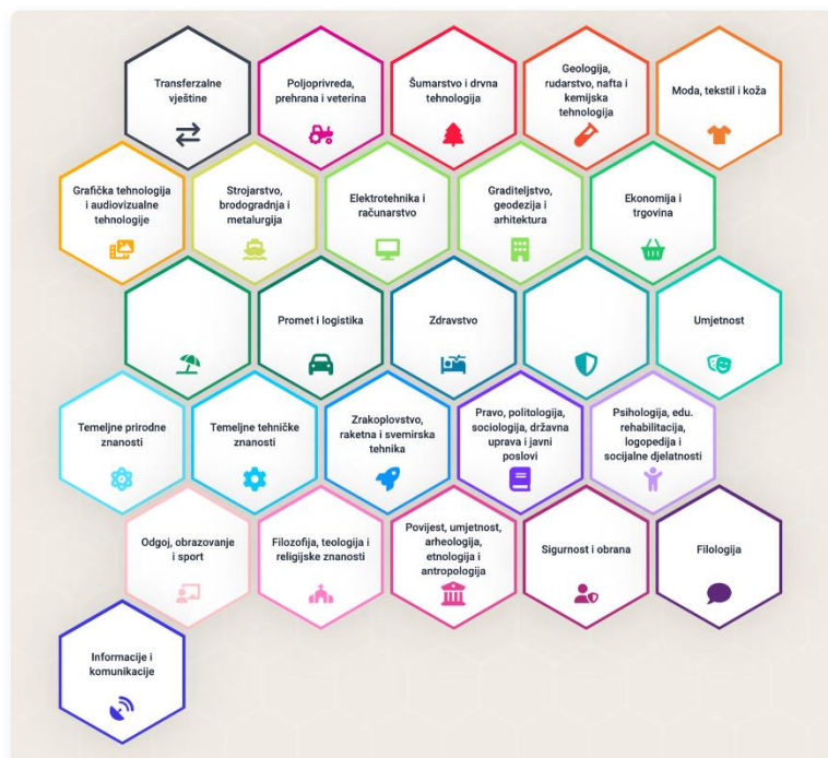
Iz Kataloga vještina: Zelene i digitalne vještine

Zabilježila: prof. dr. sc. Romana Caput-Jogunica