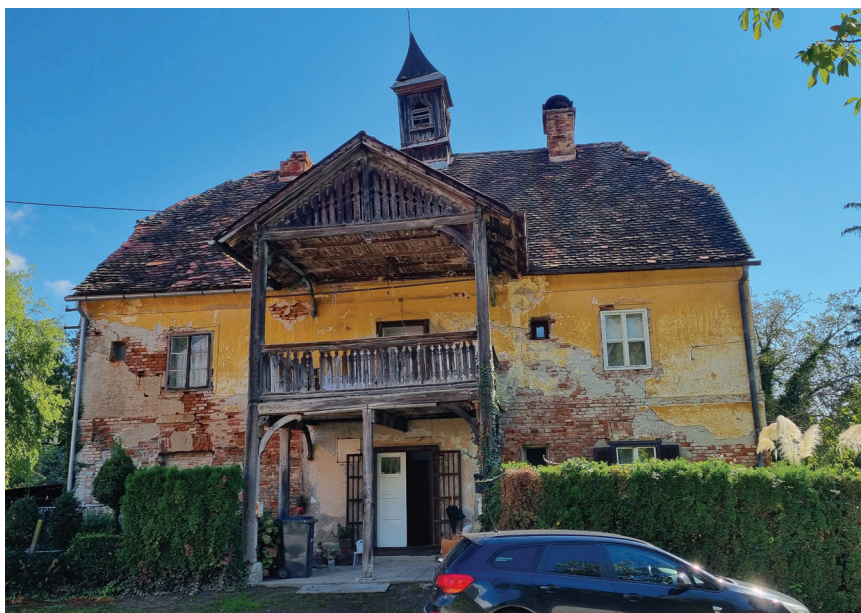
Stara Upravna zgrada fakultetskog dobra

suradnje Grada Zagreba sa Sveučilištem (Aktivnost A100008), a opremanje objekta i laboratorija sufinancirano je sredstvima Agronomskoga fakulteta i Zavoda za ribarstvo, pčelarstvo, lovstvo i specijalnu zoologiju. Pčelinjak je nakon uspješno završene rekonstrukcije službeno otvoren 19. lipnja 2015. Radi specifične gradnje koja je još davnih četrdesetih godina 19. stoljeća obuhvaćala središnju zidanu zgradu i bočna drvena krila namijenjena za paviljonski smještaj košnica, taj izvorni oblik i funkcija ostali su sačuvani do danas uz djelomičnu prenamjenu za potrebe nastave i znanstvenoistraživačkoga rada. Taj jedinstveni objekt zanimljiva je sinergija znanosti i umjetnosti.