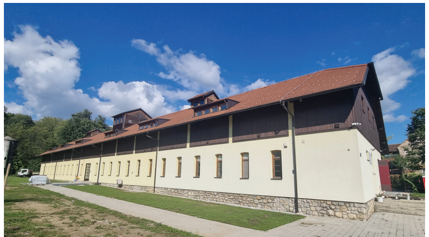
Obnovljena zgrada nekadašnje konjušnice

Podsjetimo, ukupno su uručena 42 ugovora o dodjeli bespovratnih sredstava za obnovu infrastrukture 24 visokoškolske i znanstvene ustanove u ukupnome iznosu nešto većemu od dvije milijarde