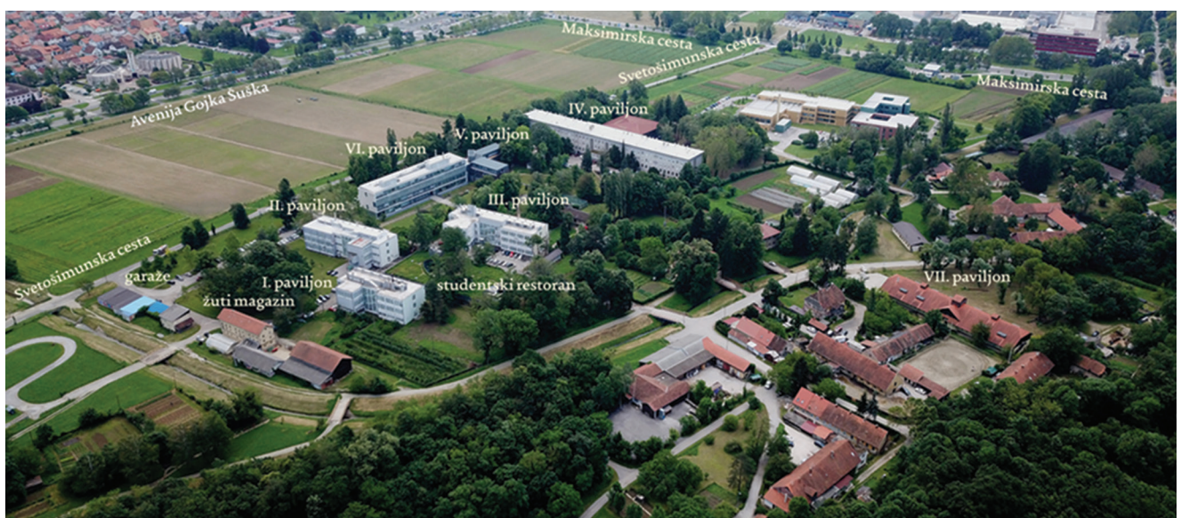
Pogled na fakultetsko dobro Agronomskoga fakulteta Sveučilišta u Zagrebu