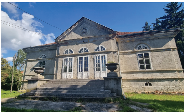
Pogled na Haulikov ljetnikovac građen oko 1840.