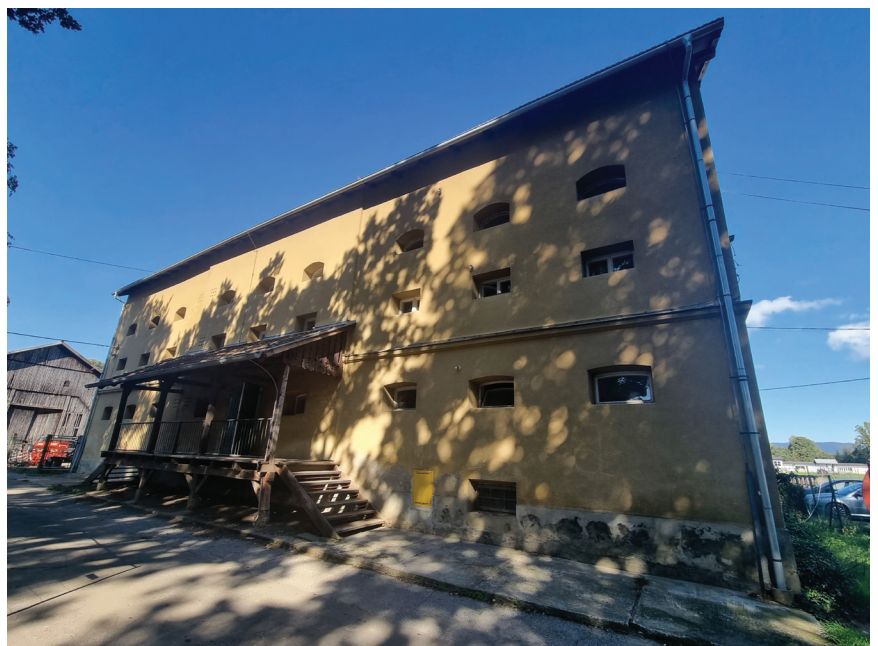
Svilana – Žuti magazin, velika gospodarska građevina sagrađena 1830.

U područje parka prirode Maksimir, gdje je smješten Agronomski fakultet, nala-