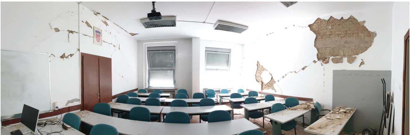
Vidljiva pukotinska oštećenja na nenosivim elementima nakon potresa