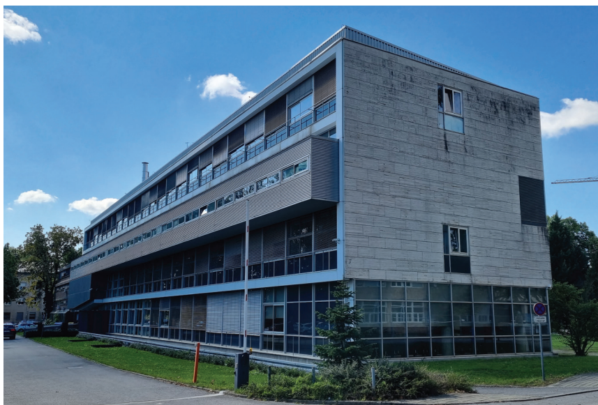
VI. paviljon Agronomskog fakulteta

zajednički sa Šumarskim odjelom, održavao se u zgradi Šumarskoga doma, a prvi dekanat i veći broj zavoda bili su smješteni u zgradi Hrvatsko-slavonskoga gospodarskog društva na Kazališnome trgu. To je društvo i darovalo zgradu