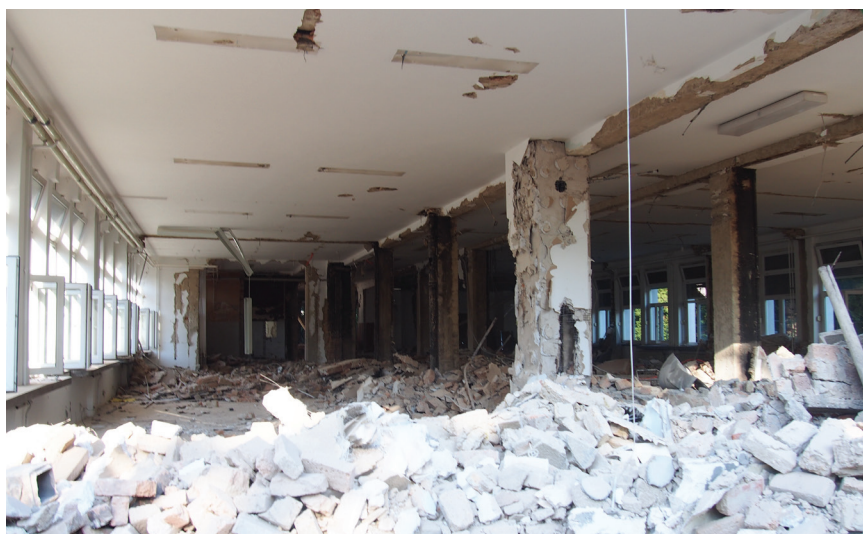
Rušenje svih pregradnih zidova u paviljonu I

Nakon pregleda postojeće dokumentacije, detaljnoga vizualnog pregleda zgrada nakon potresa i snimke oštećenja konstrukcije napravljena je klasifikacija postojećega konstruktivnog sustava, koliko je to bilo dostupno razornim i nerazornim metodama. Snimljena oštećenja nalaze se na nosivim i nenosivim elementima, a većina znatnijih oštećenja vidljiva je na poprečnim pregradnim zidovima; u tom