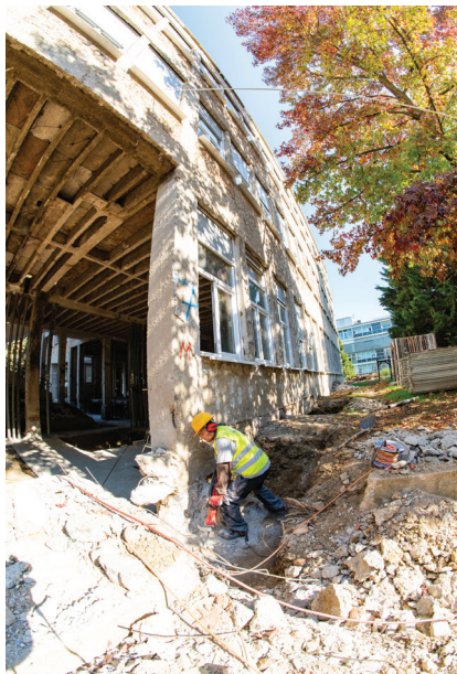
Obnova paviljona započela je čišćenjima konstrukcija