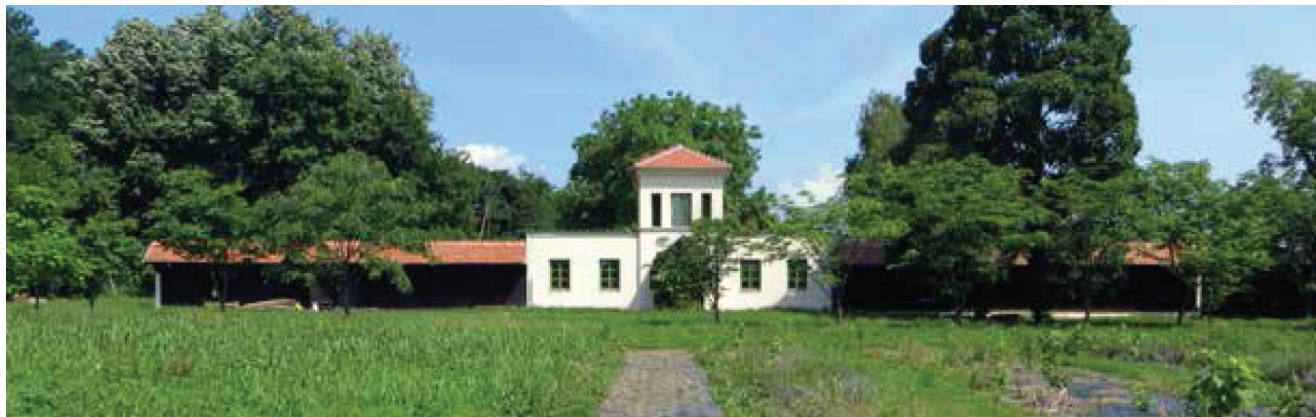
Pogled na Pčelinjak biskupa Haulika

ze se zaštićena kulturna dobra i objekti parkovne arhitekture poput Ljetnikovca biskupa Haulika i klasicističke zgrade sagrađenih prema nacrtu Franza Schüchta u periodu od 1839. do 1840. Tamo su i gospodarske zgrade Haulikova ljetnikovca, kompleks gospodarskih zgrada građen, kako se pretpostavlja, istodobno s Haulikovim ljetnikovcem u periodu od 1839. do 1840. Tu su i Svilana – Žuti magazin, velika gospodarska građevina sagrađena 1830., i Pčelinjak, prizemna zgrada sagrađena 1840., s jednokatnim središnjim dijelom namijenjenim za stan pčelara-nadlugara.