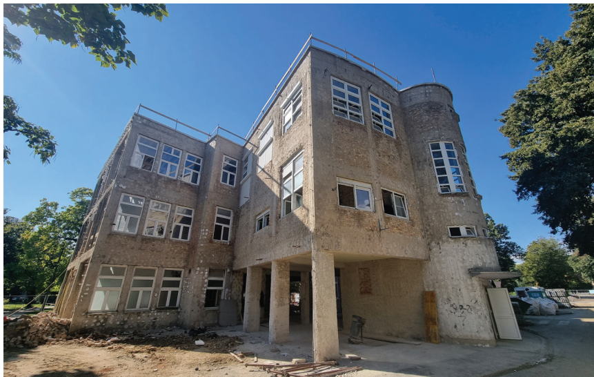
Ogoljena nosiva konstrukcija paviljona prije nastavka radova

se spajaju na postojeću konstrukciju. Na dijelu novih temelja javljaju se velike sile odizanja jer su novi zidovi proračunani tako da ne preuzimaju vertikalno opterećenje stropova. Na tim mjestima predviđena je izvedba geotehničkih sidara.