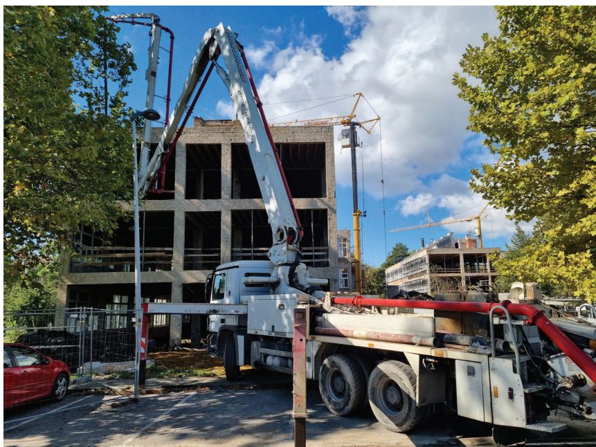
Betoniranje novih konstruktivnih elemenata

Analiza nosivosti postojeće konstrukcije utvrdila je da postojeća konstrukcija nema dovoljan kapacitet nosivosti na seizmička djelovanja za traženu razinu obnove, pa je planirana izvedba novih AB zidova koji će preuzeti većinu seizmičkoga opterećenja i rasteretiti postojeće okvire