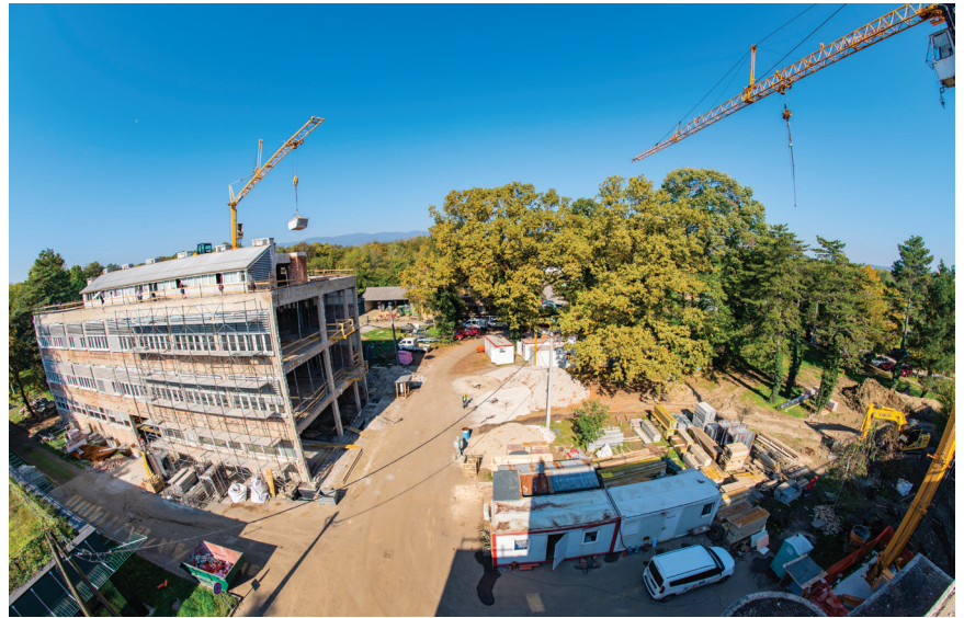
Jedan od pogleda na gradilište

Planirana je izvedba novih temelja na mjestima novih zidova. Zbog maloga tlačnog naprezanja te velikih momenata, u zidovima i temeljima javljaju se velika vlačna naprezanja. Zato su nove trake međusobno povezane te se trebaju kvalitetno spojiti s postojećim temeljima. Na pojedinim se mjestima javljaju znatne vlačne sile u temelju te je planirana ugradnja geotehničkih sidara za preuzimanje vlačnih sila. Što se sidara tiče, ona će biti izrađena u radionici, dopremljena na gradilište i ugrađena. Zatim će se kontinuirano s bušenjem injektirati sidrišne i slobodne dionice te armirati i betonirati novi temelji pa prednaprezati sidra nakon