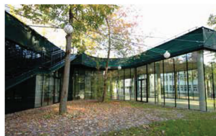
Fakultetske zgrade i novi studentski restoran prije potresa