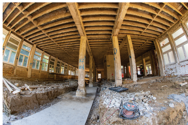
Izvođenje novih temelja u Paviljonu I

Tijekom pregleda prvoga kata uočena su pukotinska oštećenja na nosivim i neno-