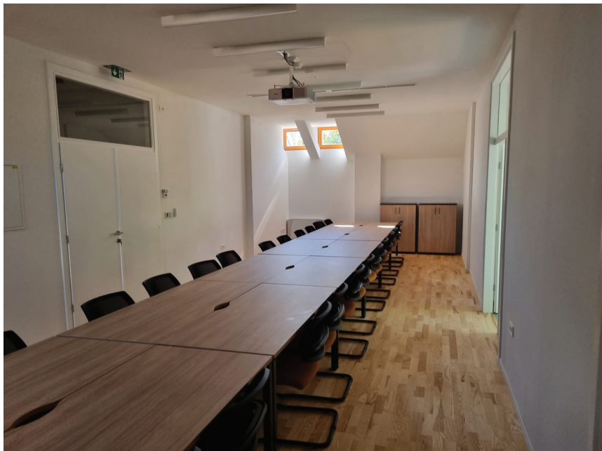
Unutrašnjost obnovljene zgrade konjušnice poslužit će za izvođenje nastave do obnove triju paviljona

kuna. Prof. Kisić rekao je to da je obnova Agronomskoga fakulteta počela 4. srpnja 2022.