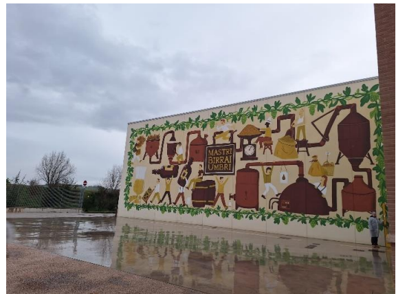
Mastri Birrai Umbri