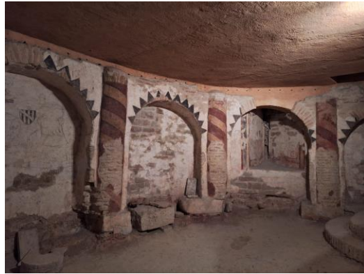
Crkva s kriptom