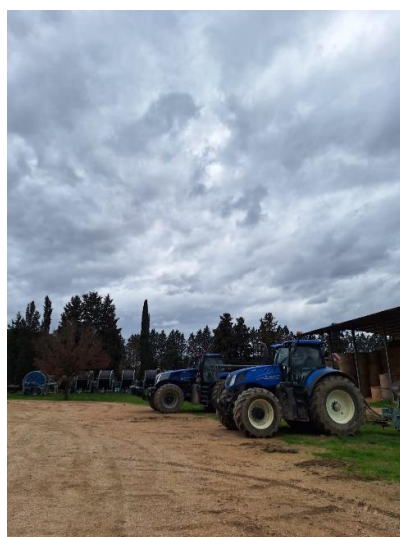
Fondazione per l'Istruzione Agraria