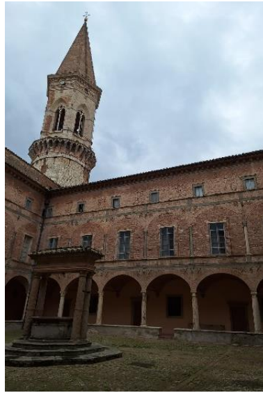
Universita degli studi di Perugia