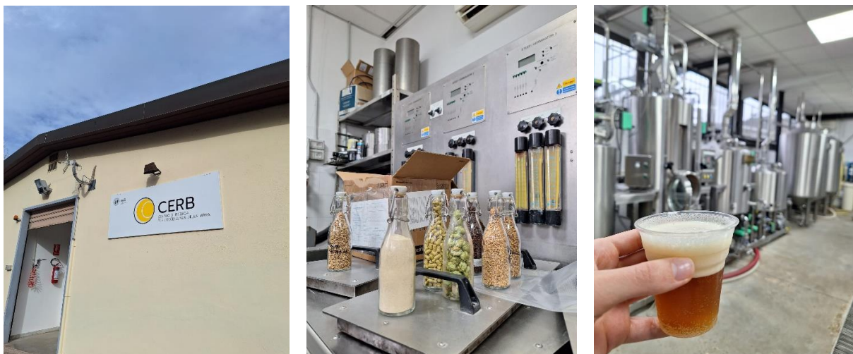
Centar za istraživanje kvalitete piva

*Trade Fair je tradicionalni dio svakog IAAS-ovog događaja. Svaka zemlja članica priprema tradicionalnu hranu svoje zemlje i tako koristi priliku da ostalim članicama pokaže dio svoje kulture. Trade Fair također prati i krađa zastava, pobjednica večeri je zemlja članica koja neopaženo uspije ukrasti što više tuđih zastava.