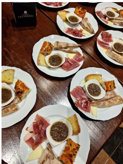
Terre de la Custodia